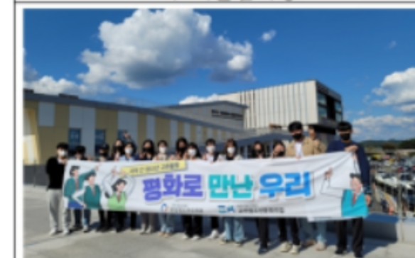
타 기관 교류활동